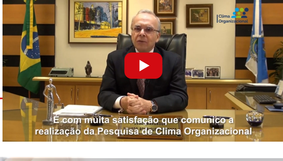
É com muita satisfação que comunico a realização da Pesquisa de Clima Organizacional