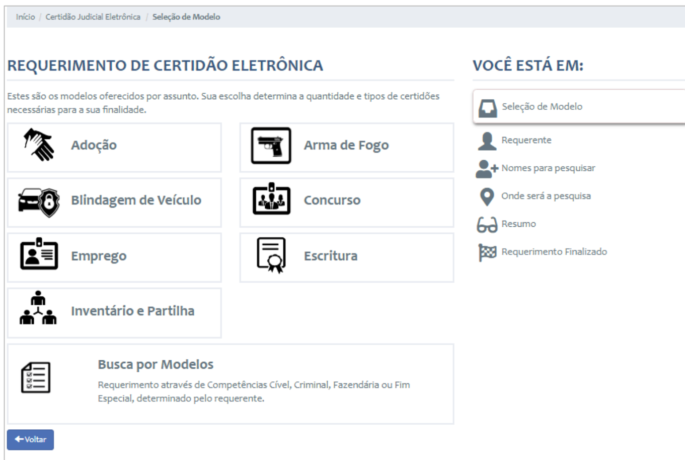
Figura 5 – Requerimento de Certidão Eletrônica – Seleção de Modelo.