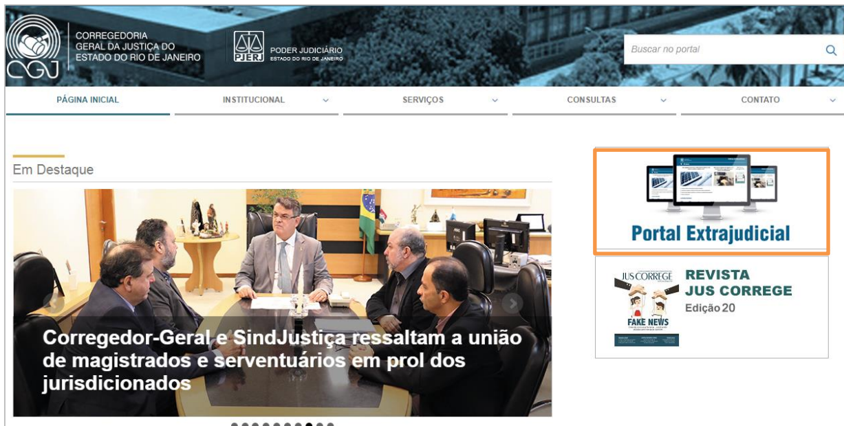
Figura 2 – Acessando Portal Extrajudicial.

Na página da Corregedoria Geral de Justiça, clique em Portal Extrajudicial .