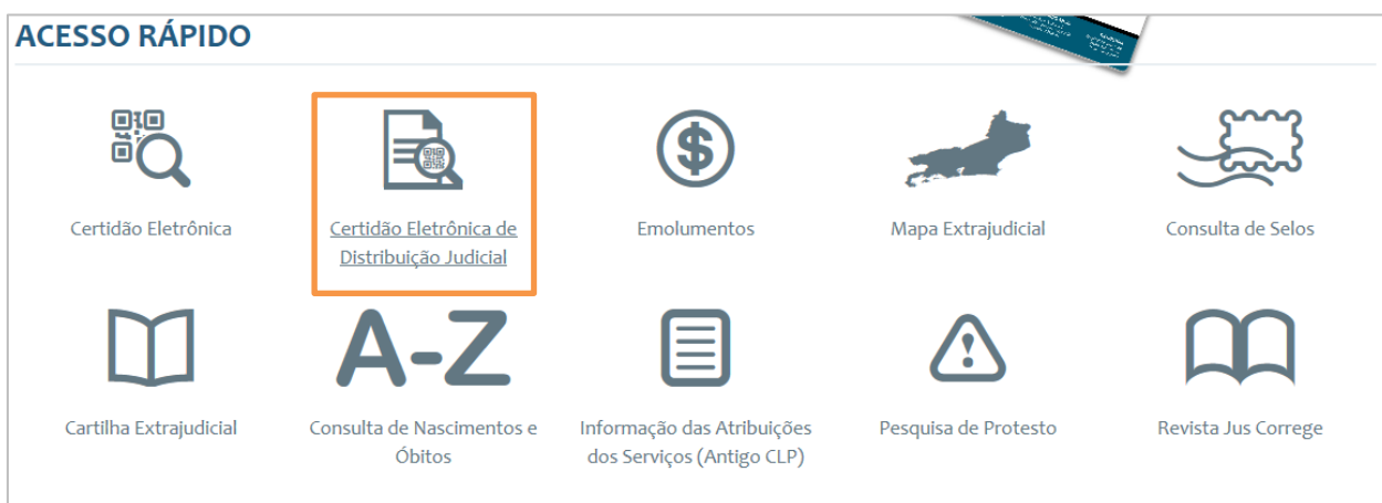
Figura 3 – Guia de Acesso Rápido: Certidão Eletrônica de Distribuição Judicial.

Na guia de Acesso Rápido , na parte inferior do Portal Extrajudicial, clique em Certidão Eletrônica de Distribuição Judicial .