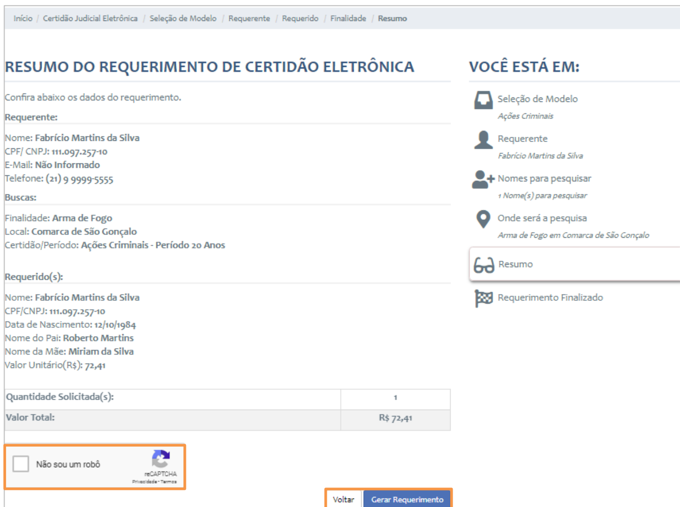
Figura 9 – Requerimento de Certidão Eletrônica – Resumo.

Confira o Resumo do requerimento , caso alguma informação esteja incorreta clique em Voltar para retificar as informações, se está de acordo com as informações preenchidas clique em Gerar Requerimento .