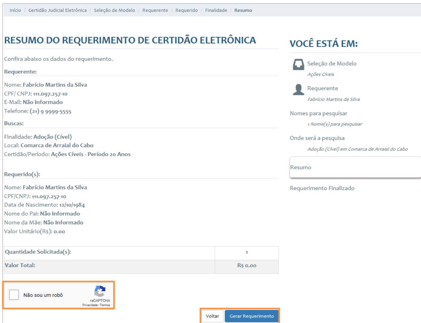
Figura 18 – Requerimento de Certidão Eletrônica – Resumo.

Confira o Resumo do requerimento, caso alguma informação esteja incorreta clique em Voltar para retificar as informações, se está de acordo com as informações preenchidas clique em Gerar Requerimento .