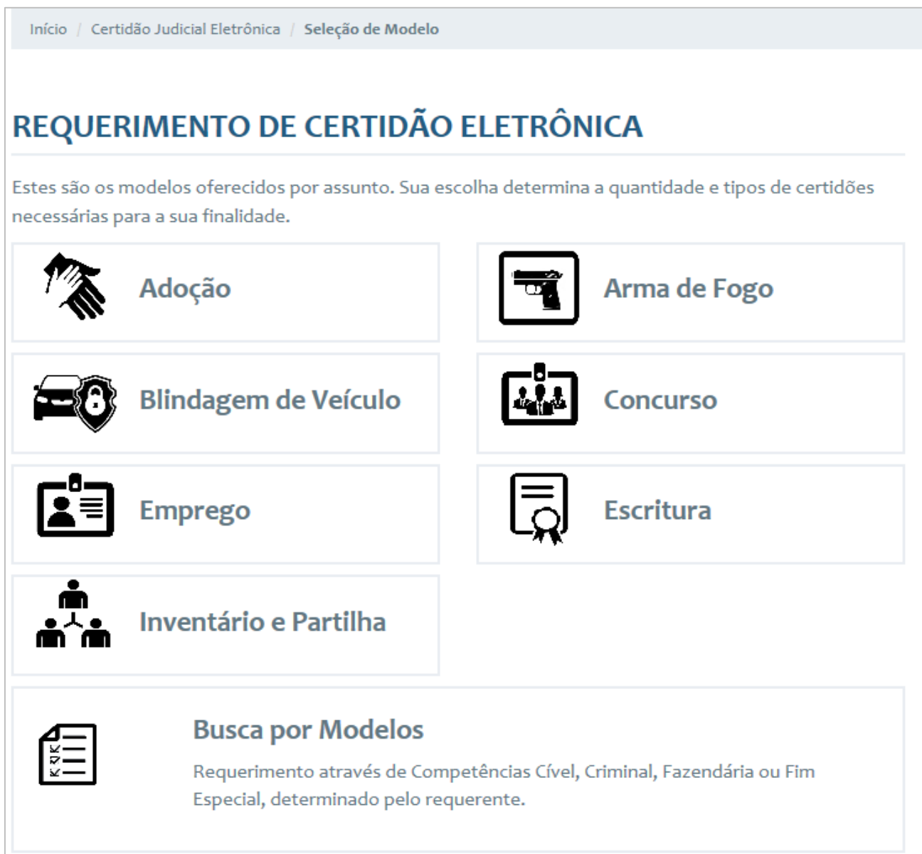
Figura 21 – Requerimento de Certidão Eletrônica – Modelos de Requerimento de Certidão.

Existem alguns modelos pré definidos para requerimento, estes são denominados por assunto ou se preferir o requerimento pode ser feito através de competências , sendo elas Cível, Criminal, Fazendária ou Fim Especial, determinado pelo requerente. Os referidos modelos estão disponibilizados na Seleção de Modelo , observe a tela abaixo: