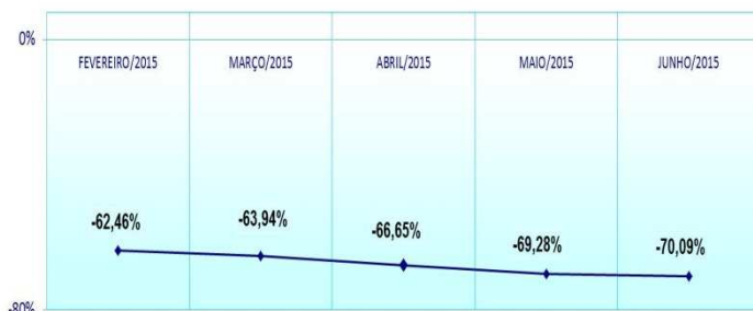
VARIAÇÃO MÉDIA DE CUSTO DE OBRA LICITADO

O gráfico demonstra em índices a diferença entre o que se pretendia alcançar pela previsão do custo licitado e o que efetivamente foi alcançado no desenvolvimento da obra até o momento.