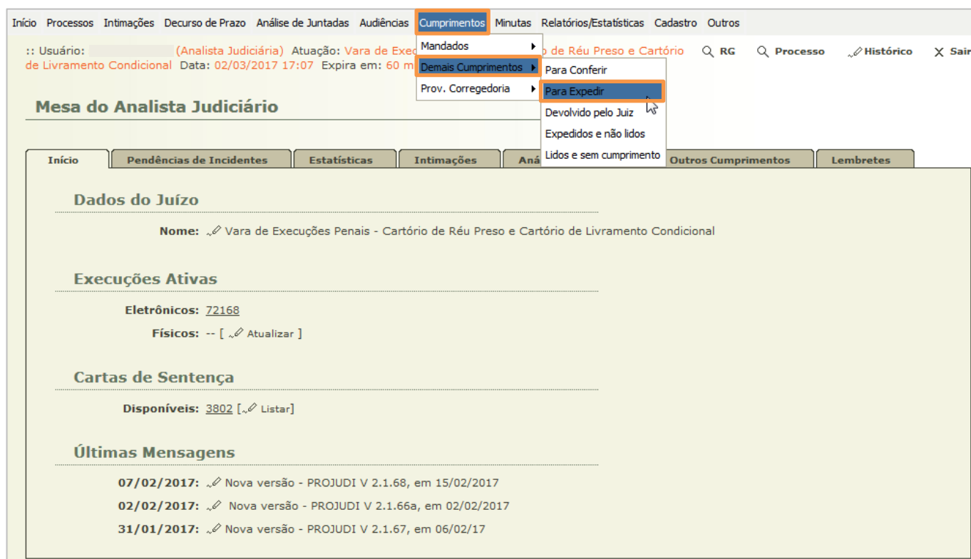
Figura 8 – Menu Cumprimentos / Demais Cumprimentos / Para Expedir.

Para expedição do mandado de prisão, após sua ordenação, é necessário acessar o menu Cumprimentos / Demais Cumprimentos / Para Expedir .