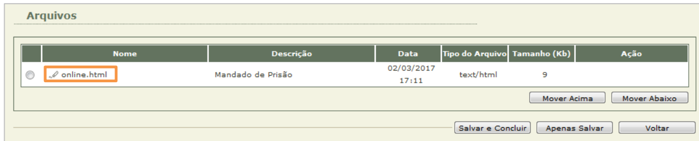
Figura 11 – Tela Arquivos.

Para visualizar o mandado clique sobre o seu nome "online.html".