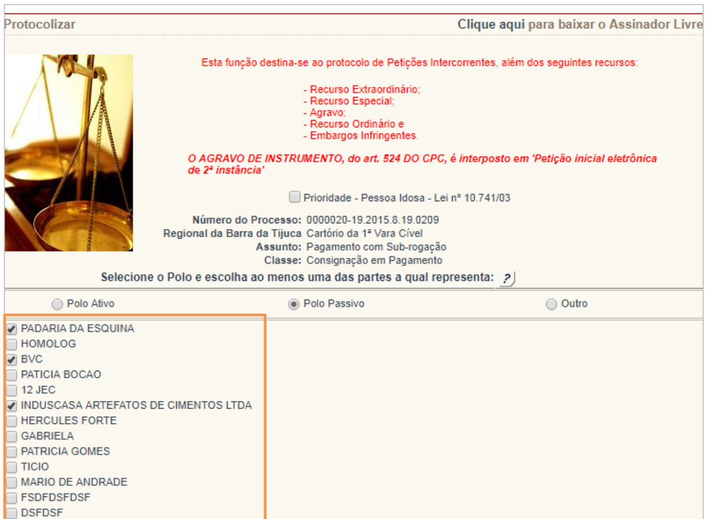
Figura 2 – Escolha das partes do polo.

Caso ele esteja representando o polo passivo e ainda não esteja incluído no processo, o sistema irá inclui-lo assim que a petição for junta aos autos.