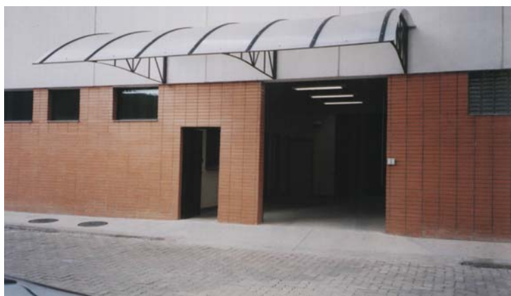
Entrada principal do Prédio da Unidade Regional DGA – Itaipava (Anexo ao Fórum de Itaipava)