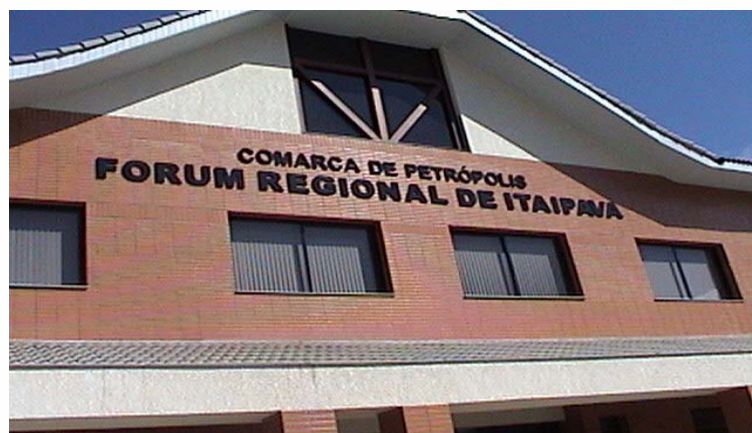
Fórum Regional de Itaipava