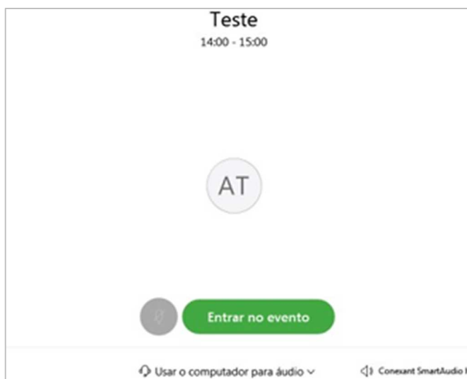
Figura 6 – Entrar no evento .

Para ingressar na Sessão, clique em Entrar no evento .