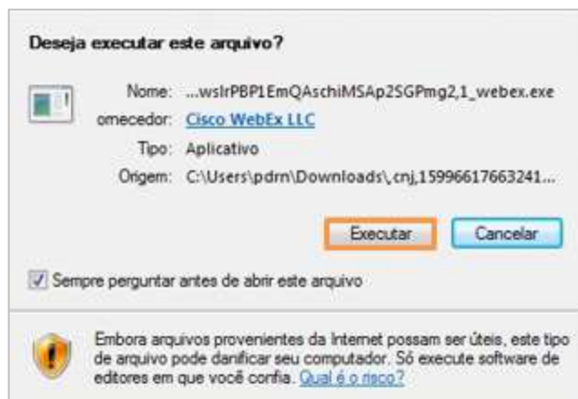
Figura 4 – Botão Executar .

Ao fim do download, clique em Executar na janela que será exibida para instalar o aplicativo: