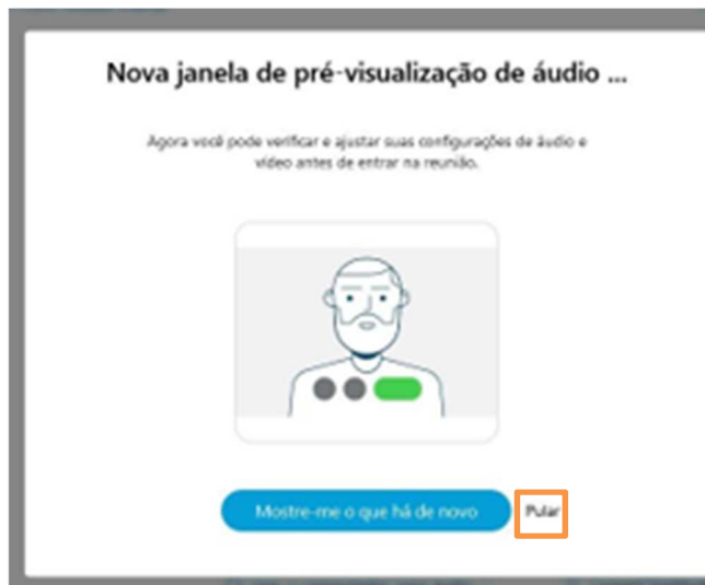
Figura 5 – Botão Pular .

Para ingressar na Sessão, clique em Entrar no evento .