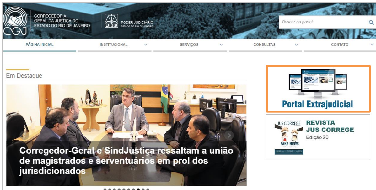
Figura 2 – Página da Corregedoria Geral da Justiça – Portal Extrajudicial.

Na página da Corregedoria Geral de Justiça clique em Portal Extrajudicial .