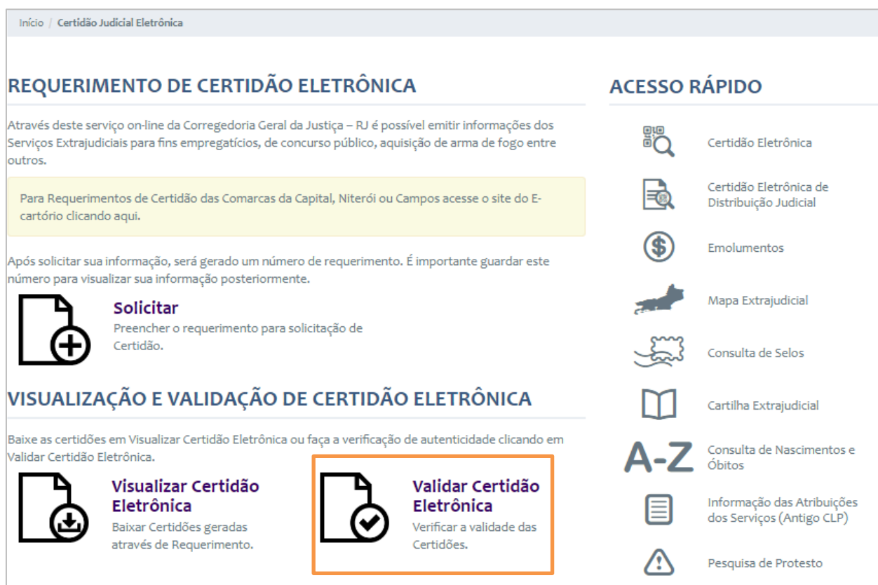
Figura 4 – Validar Certidão Judicial Eletrônica – Validar Certidão Eletrônica.

Para verificar a validade de uma Certidão Judicial Eletrônica, clique no botão Validar Certidão Eletrônica .