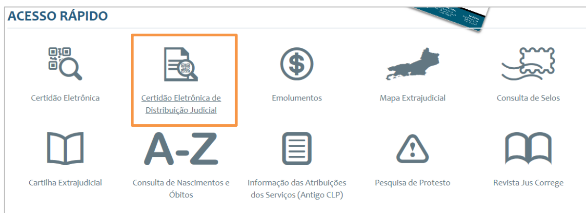
Figura 3 – Guia de Acesso Rápido: Certidão Eletrônica de Distribuição Judicial.

Na guia de Acesso Rápido , na parte inferior do Portal Extrajudicial, clique em Certidão Eletrônica de Distribuição Judicial .