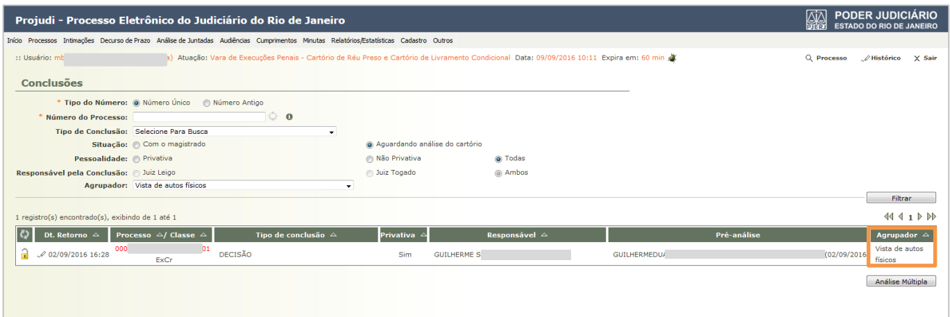
Figura 6 – Agrupador.

OBSERVAÇÃO: Sempre que um advogado peticionar com os modelos “Petição - *Pedido de Vista de Autos Físicos” e “Petição - *Pedido de Urgência na Certificação de Autos”, o sistema classificará o processo com os Agrupadores “Vista de autos físicos” e “Urgência na certificação de autos”, respectivamente. Estes tipos de peticionamento vão direto para a conclusão do juiz e, ao retornarem do cartório, continuarão com esta classificação, exceto nos casos em que o gabinete alterar este campo.