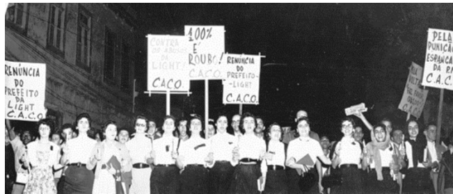
Estudantes protestam contra o aumento da tarifa dos bondes no Rio, em 1956.