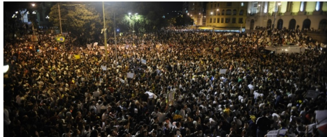
Manifestantes lotam a Cinelândia em 17 de junho de 2013.