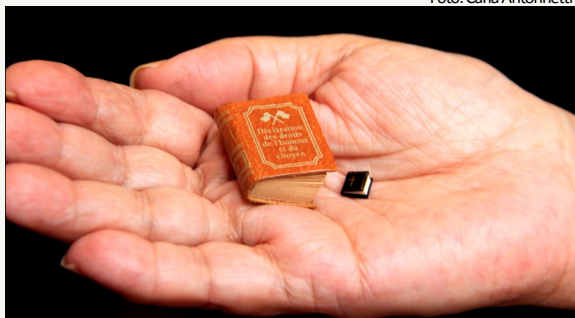
As miniaturas da Declaração dos Direitos do Homem e do Cidadão e da Bíblia de Gutemberg fazem parte do acervo

O Serviço de Gestão de Acervos Bibliográficos (SEGAB), do Museu da Justiça, concluiu no fim de setembro a primeira etapa da higienização, restauração e encadernação de obras de grandes operadores do Direito. Segundo a chefe de serviço do SEGAB, a bibliotecária Ma-